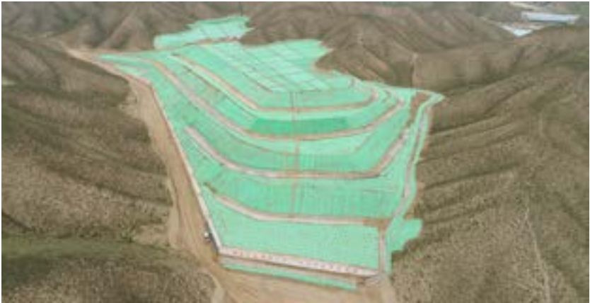
铁路弃土场拦挡、削坡分级、排水和临时防护