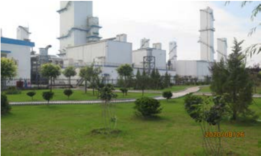
化工项目工业厂区植被恢复