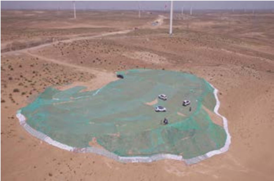
风沙区弃土场临时苫盖、拦挡措施