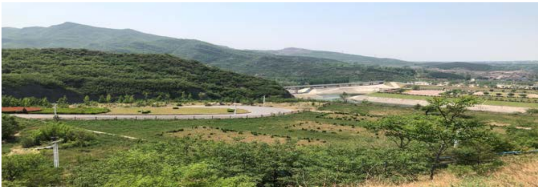
水利工程施工生产生活区植被恢复