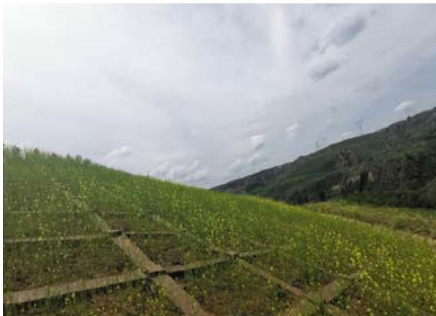
煤矿排矸场工程骨架结合植物综合护坡