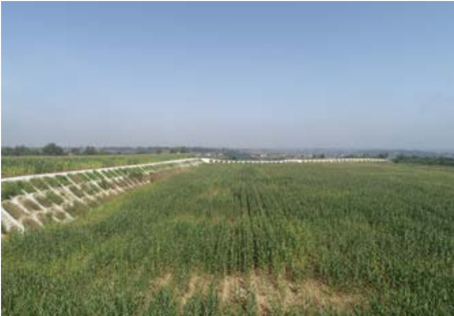
铁路取土场边坡防护及土地复耕