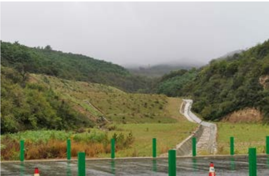
高速公路弃土场综合防治