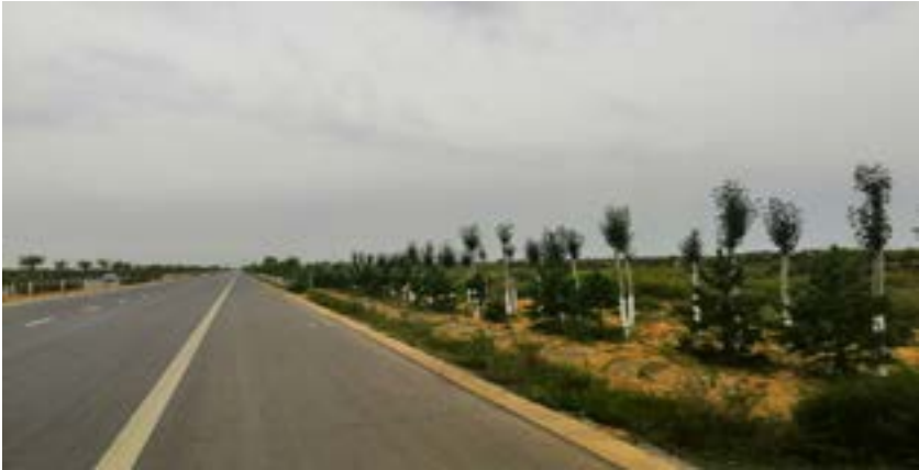
煤矿进场道路两侧绿化