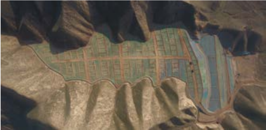
铁路弃渣场渣面土地整治及临时苫盖防护