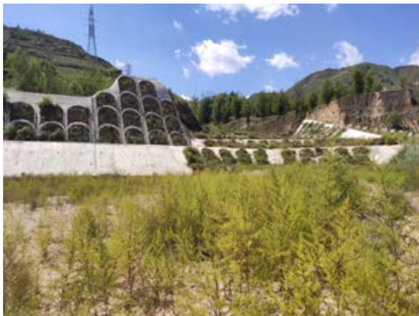
铁路取土场综合整治