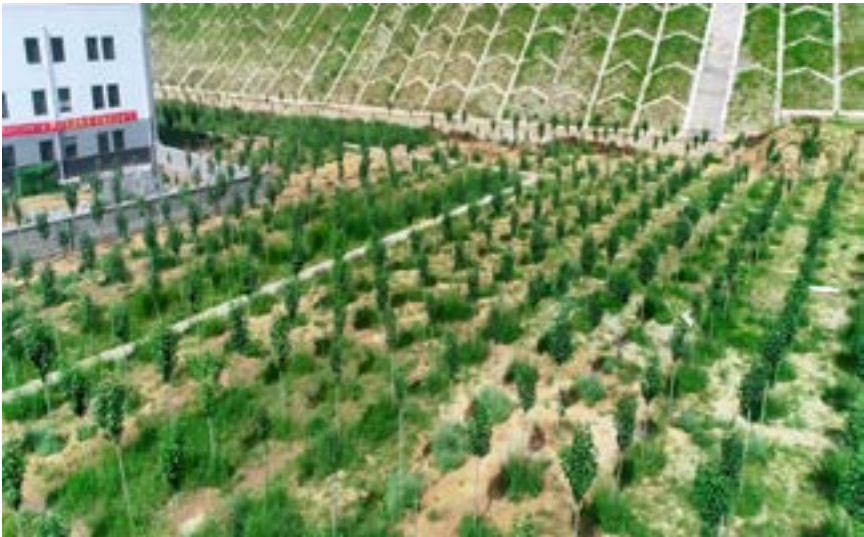
煤矿场区及边坡绿化