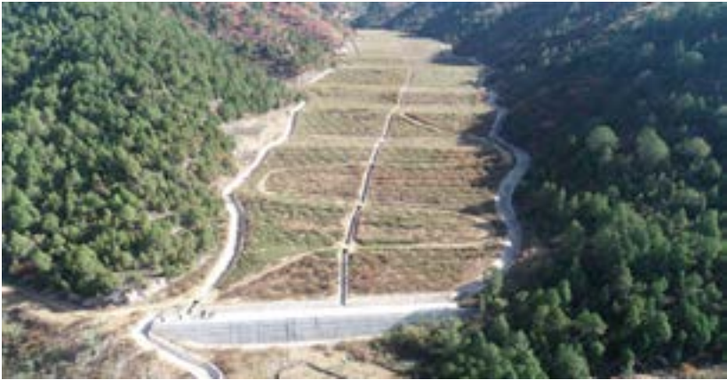
铁路弃渣场“堆挡拦排护用”综合防治体系