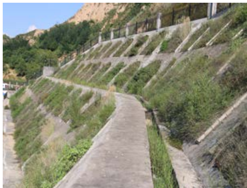
煤矿项目工业厂区边坡防护